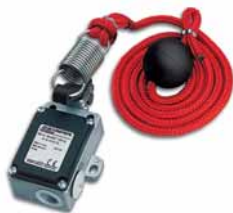
Zugtaster mit Seil