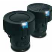
BHS 211, BHS 221