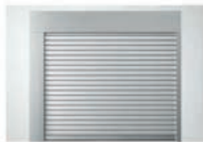
Einbauvariante zw. der Laibung