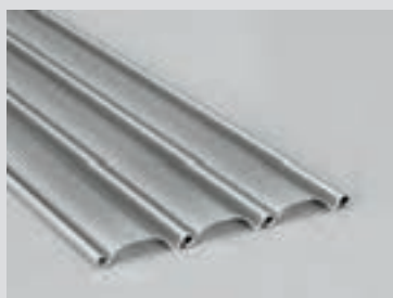
R15 Visual Lamelle