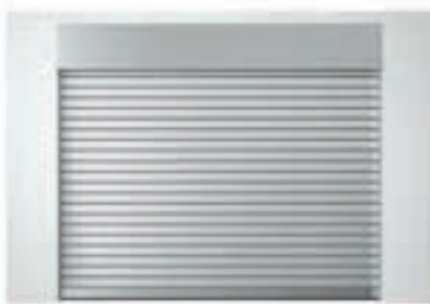
Einbauvariante mit Sturzblende