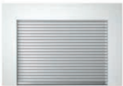
Einbauvariante hinter der Laibung