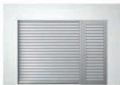
Einbauvariante mit Nebentür