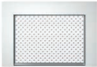
Einbauvariante hinter der Laibung