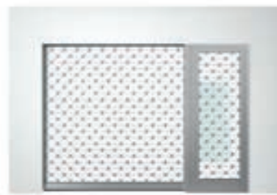
Einbauvariante mit Nebentür