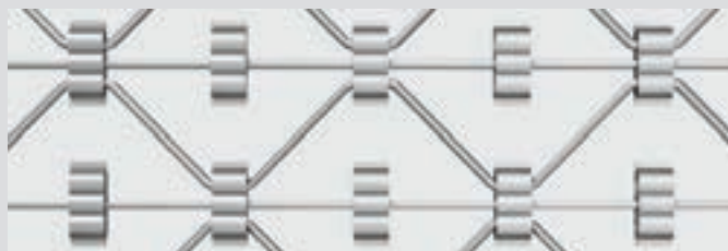
ProTect Plus (Zusatzclips)

Als Ausführung ProTect Plus mit einem zusätzlichen Verbindungselement in der Wabe eignet sich das Gitter auch für Schaufenster mit höheren Sicherheitsanforderungen wie z. B. Juweliere.