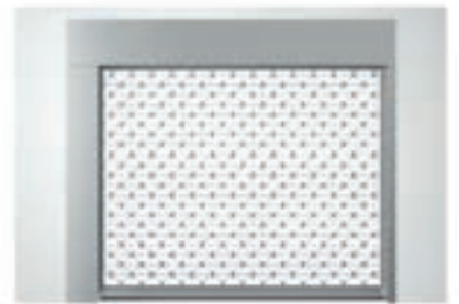
Einbauvariante zw. der Laibung