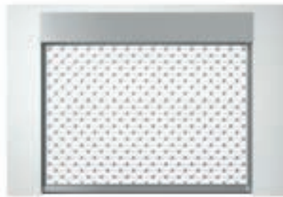
Einbauvariante mit Sturzblende